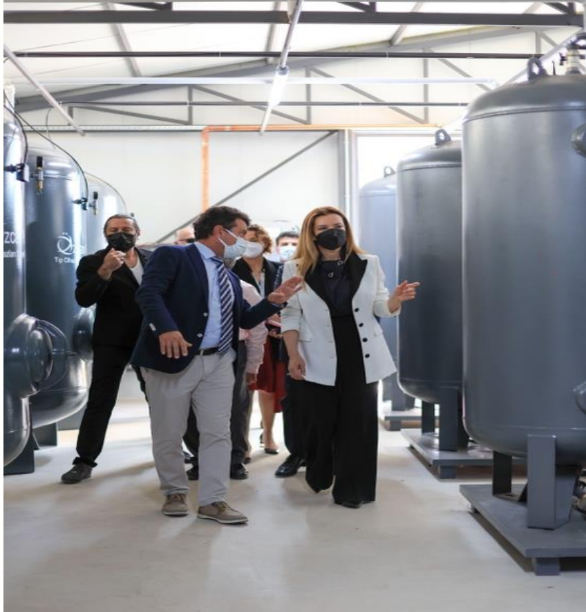
Medikal Oksijen Üretim Tesisi

Harcamaların ekonomik gider sınıflandırmasına göre detayları aşağıdaki tabloda verilmiştir.