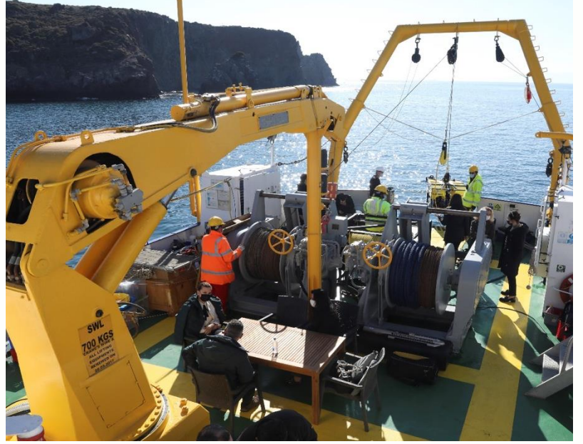
Sualtı Kültür Mirası Araştırmaları