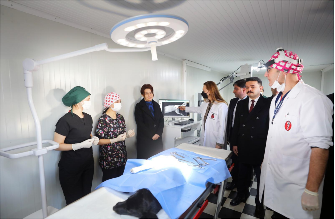
Kiraz Veteriner Fakültesi Konteyner Laboratuvar