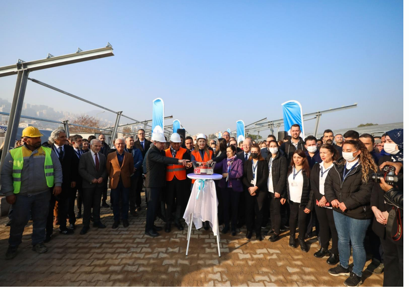
Merkezi Yemekhane Binası İnşaatı