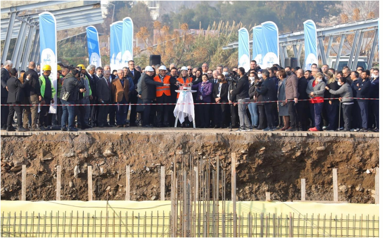
Tablo 10: Derslik ve Merkezi Birimler Projesi Harcama Tutarı

2022 Yılı içerisinde 15 Temmuz Sağlık ve Sanat Yerleşkesi içerisinde planlanan Merkezi Yemekhane Binası'nın yapım işi ihalesi yapılmış ve yapım işlerine başlanmıştır. Yılsonu harcama tutarı 10.009.356-TL 'dir