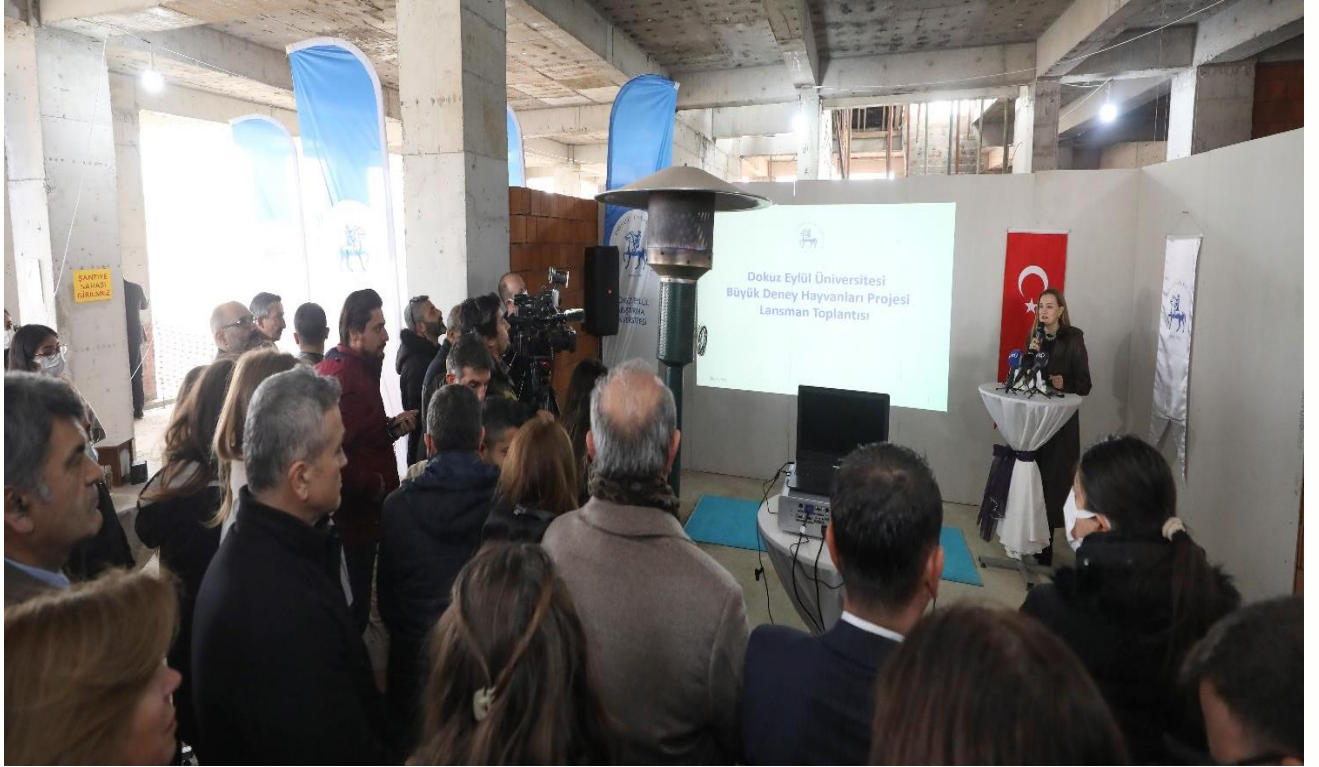
Büyük Deney Hayvanları Araştırma Laboratuvarı Lansmanı