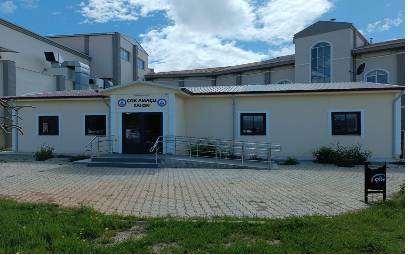
Uygulamalı Bilimler Yüksekokulu Çok Amaçlı Salon