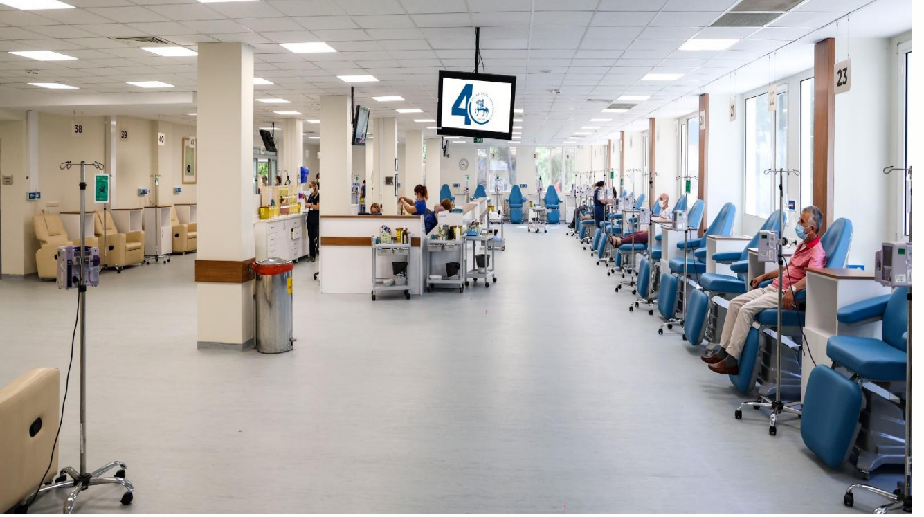
Gündüz Tedavi Merkezi Kemoterapi Ünitesi