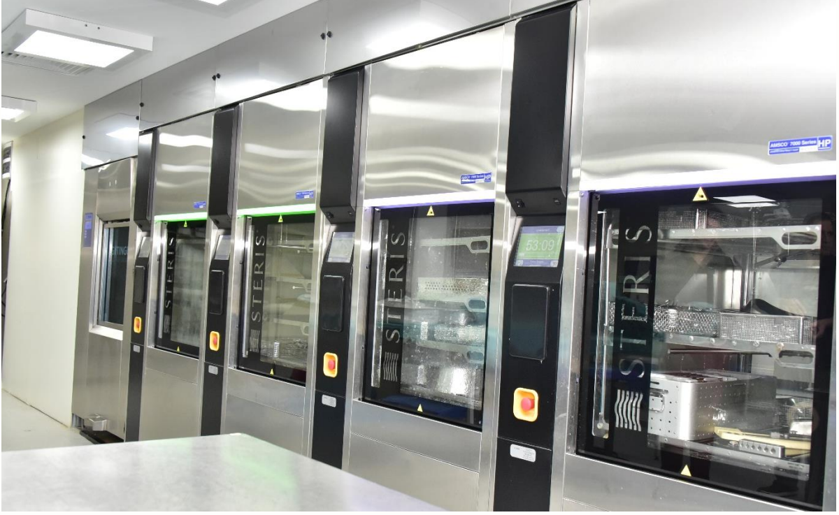
Merkezi Sterilizasyon Ünitesi