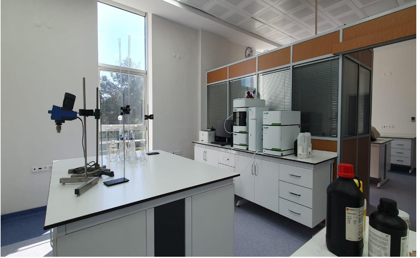
Merkezi Araştırma Laboratuvarı