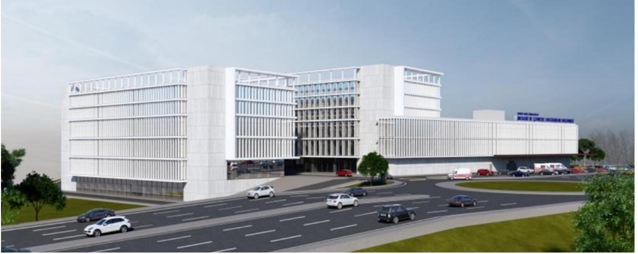
Aliğa Mesleki ve Çevresel Hastalıklar Hastanesi