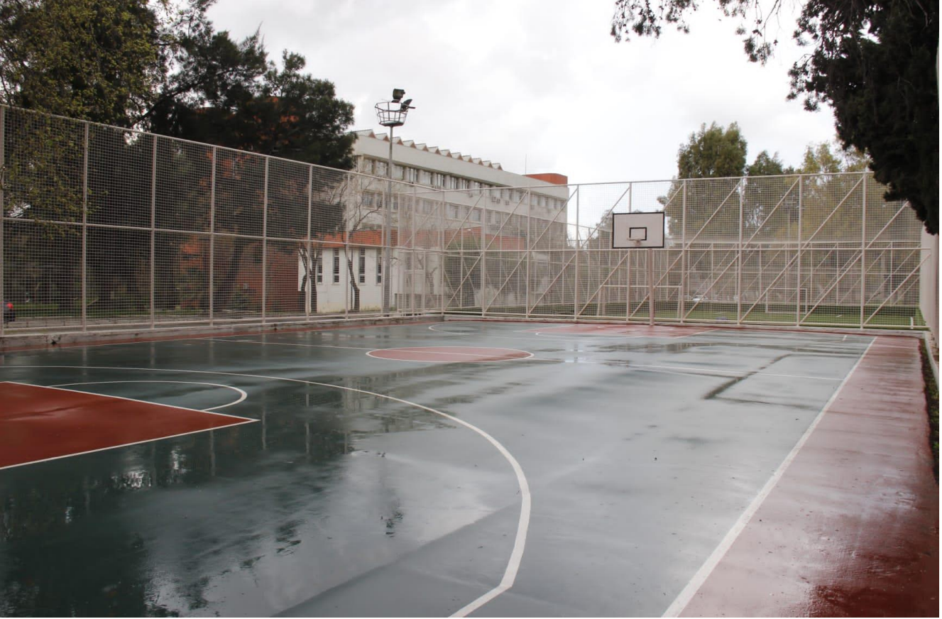
Dokuzçesmeler Yerleşkesi Açık Basketbol Sahası