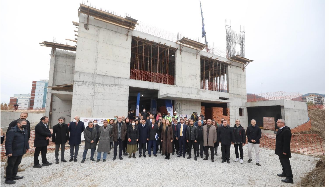
Büyük Deney Hayvanları Araştırma Laboratuvarı İnşaati

Söz konusu laboratuvarın 2022 yılı içerisinde proje revizyonu Strateji ve Bütçe Başkanlığı'nca kabul edilmiş ve revizyon sonrası yapım işi ihalesi gerçekleştirilmiştir.2023 yılı içerisinde yapım işinin tamamlanması hedeflenmektedir.