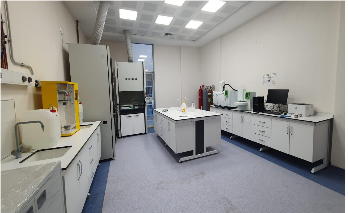
Merkezi Araştırma Laboratuvarı