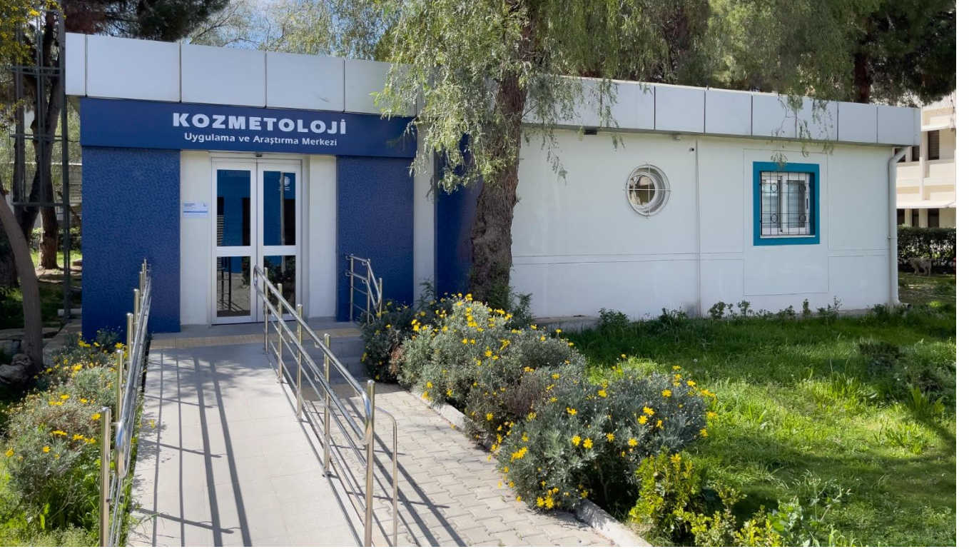
Kozmetoloji Uygulama ve Araştırma Merkezi