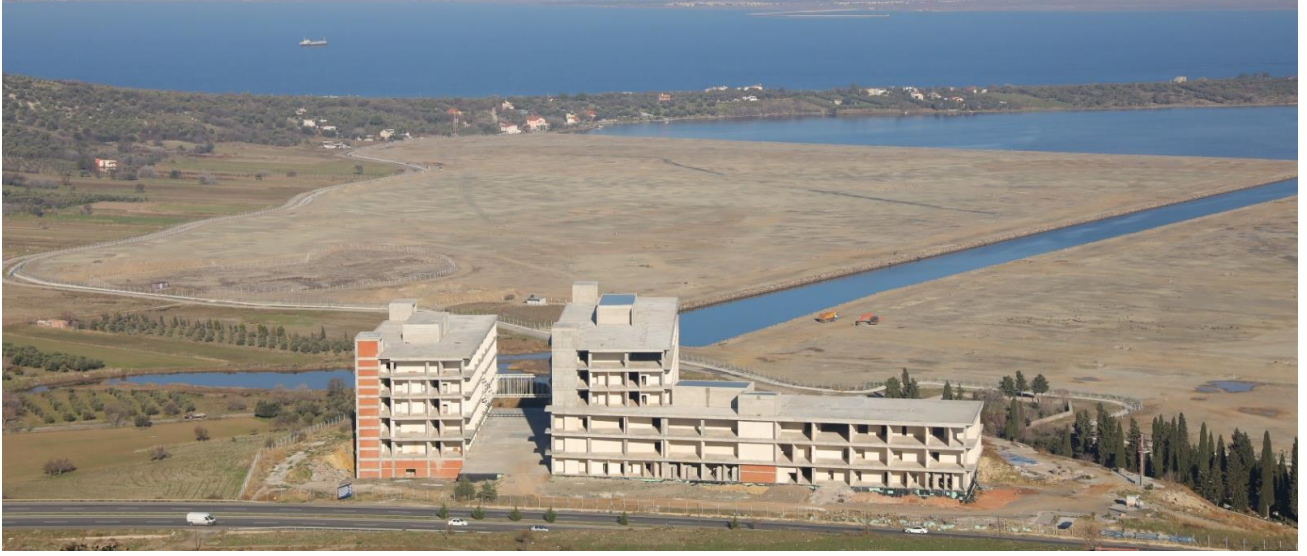
Aliğa Mesleki ve Çevresel Hastalıklar Hastanesi