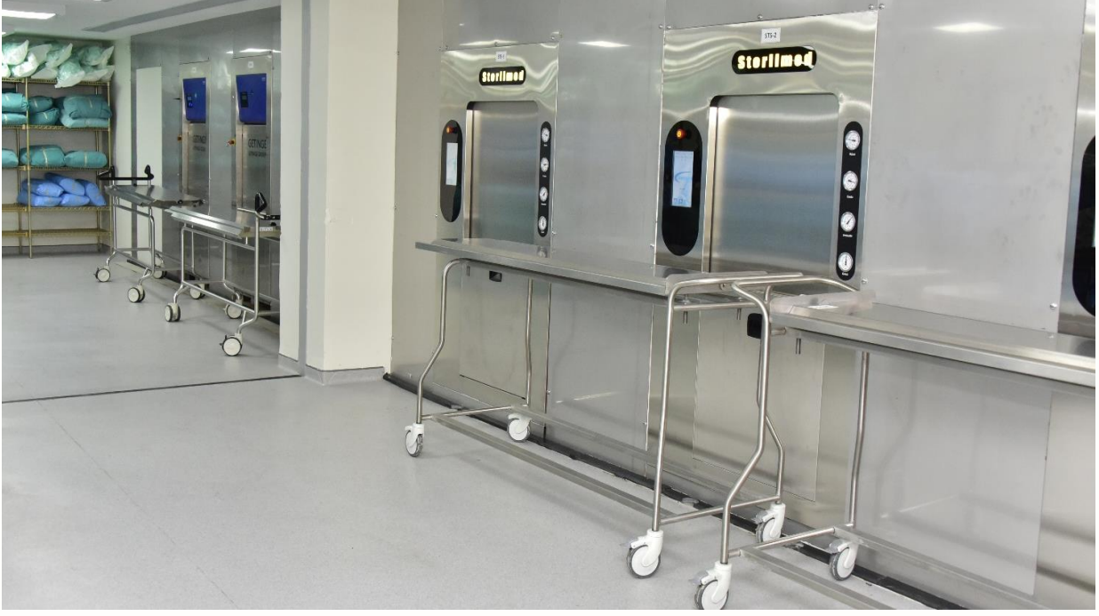
Merkezi Sterilizasyon Ünitesi