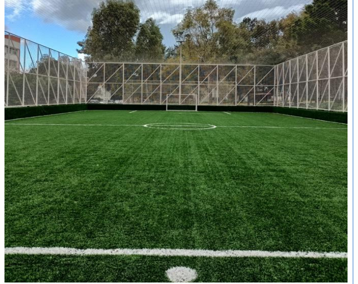
Dokuzçesmeler Yerleşkesi Halı Sahası