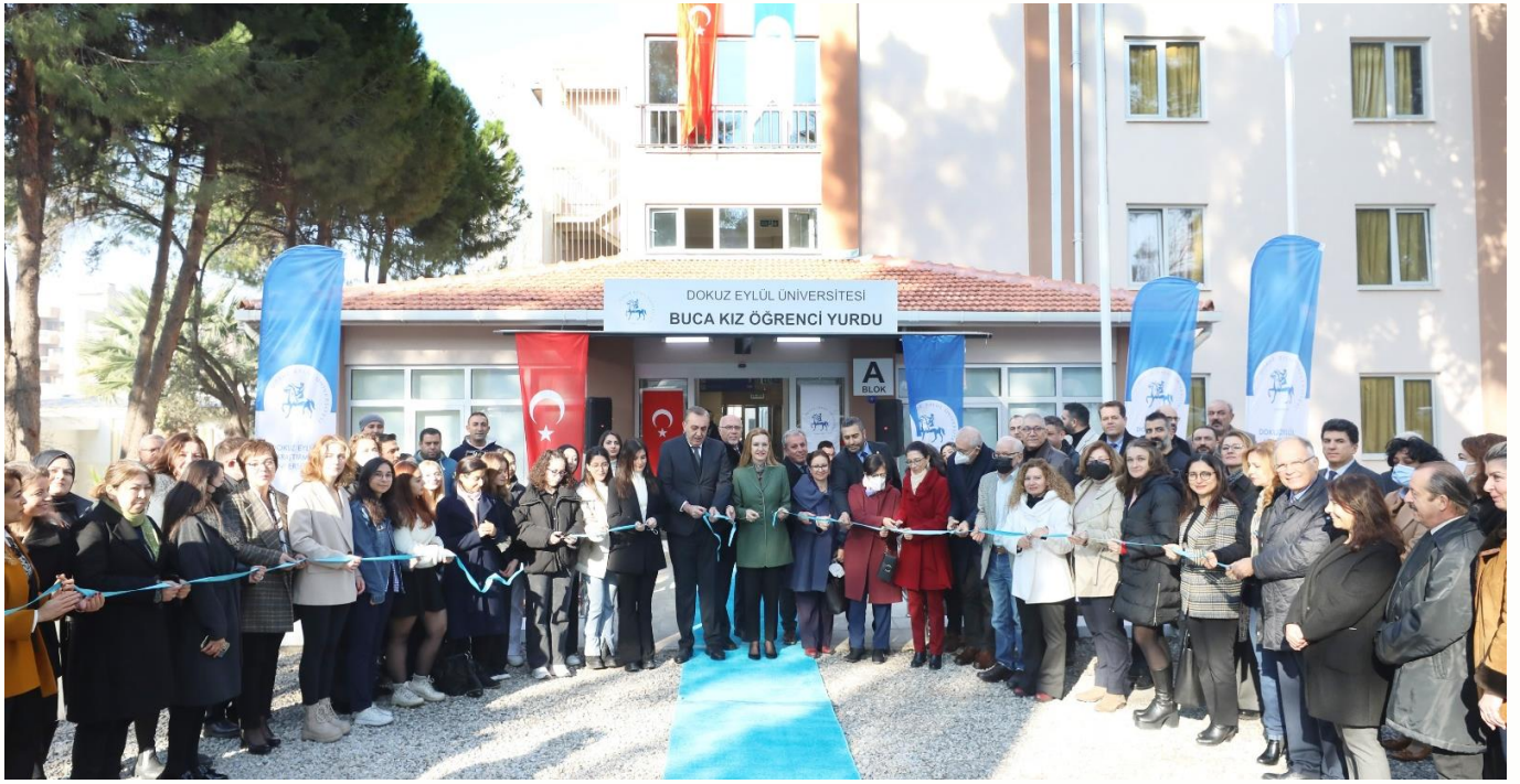
Buca Kız Öğrenci Yurdu