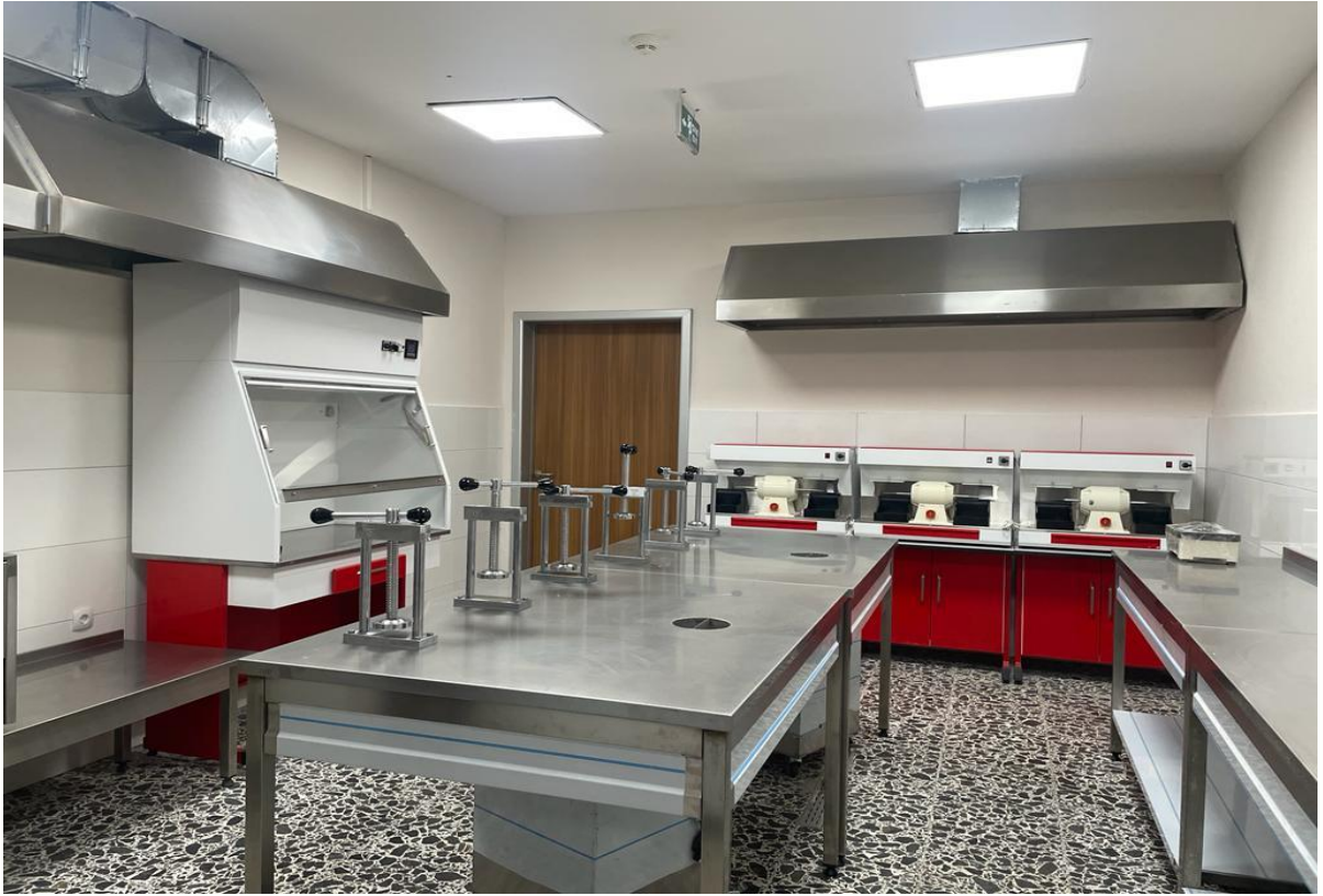
*Diş Hekimliği Fakültesi Fantom ve Mum Laboratuvarı