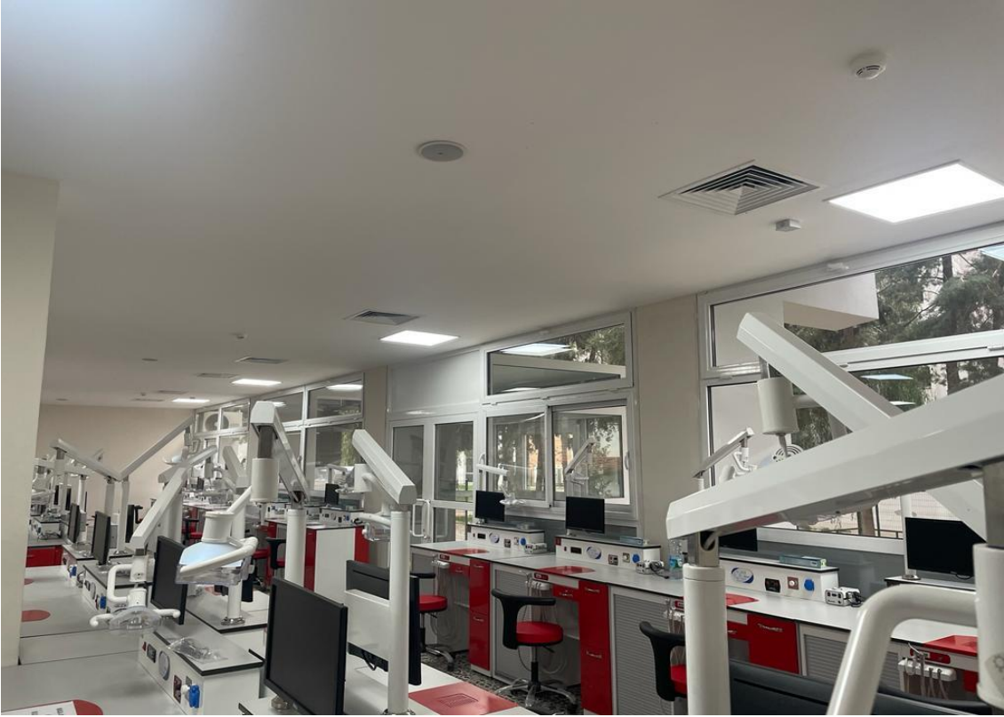
*Diş Hekimliği Fakültesi Fantom Laboratuvarı