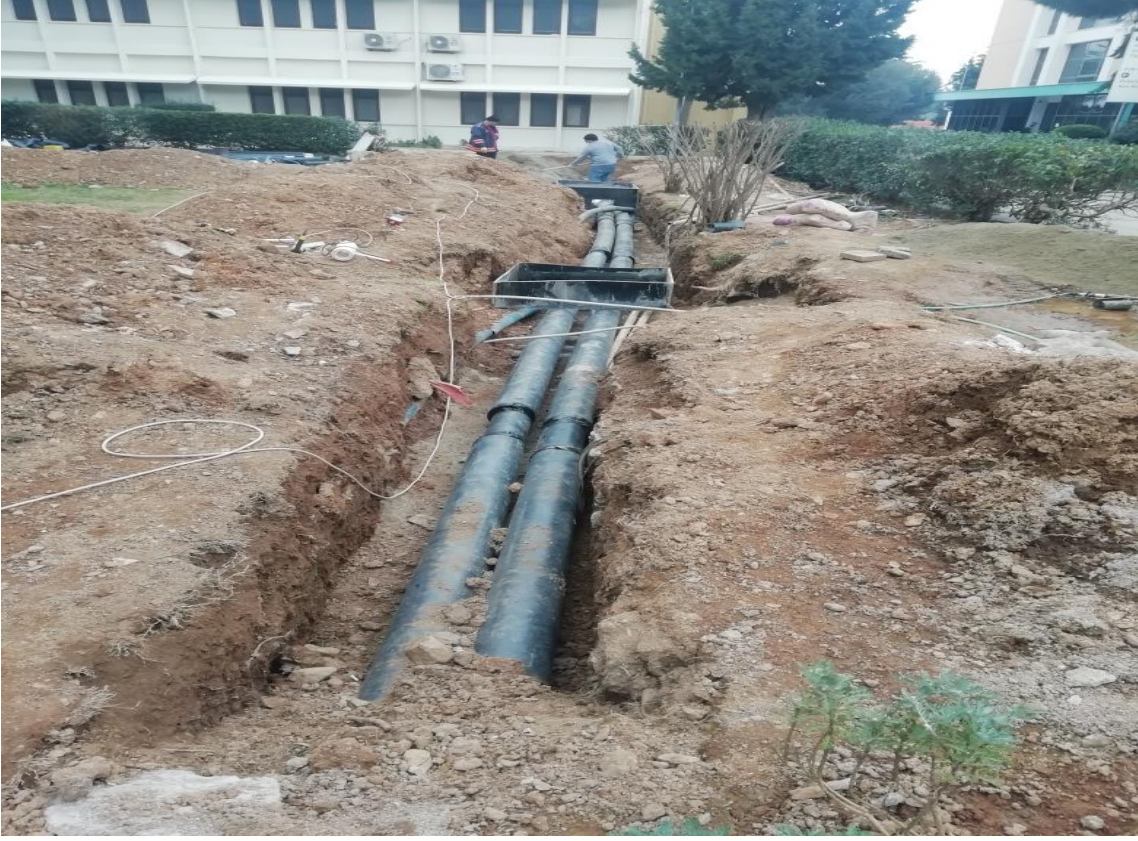
*Sekonder Isıtma Sistemi Alt Yapısının Yenilenmesi İşi