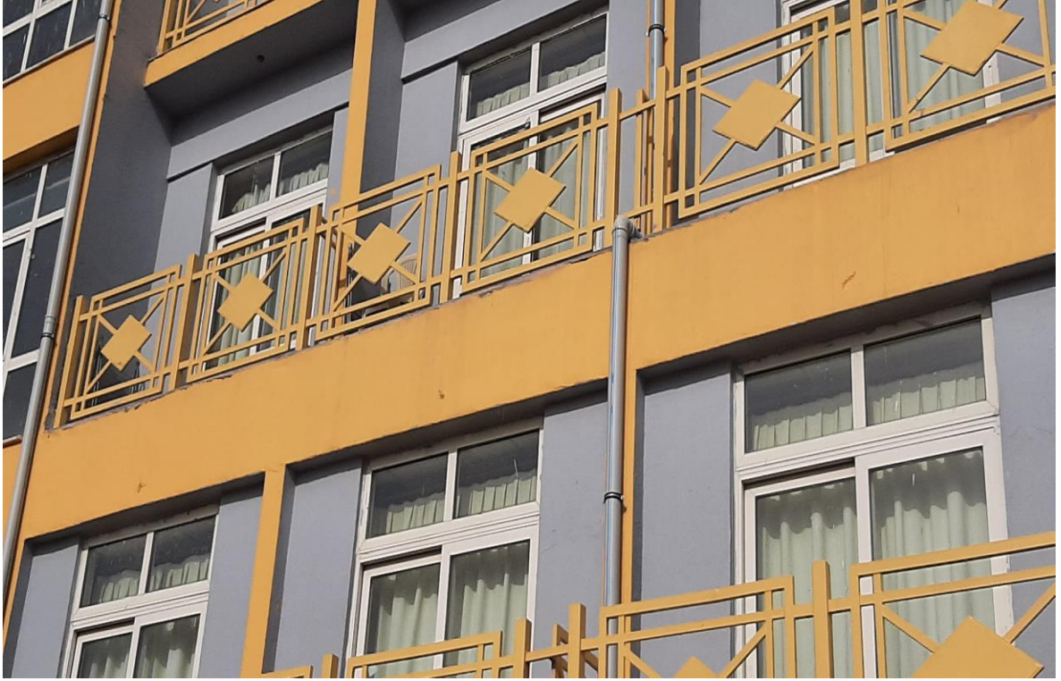
*Buca Öğrenci Yurdu Tadilatı