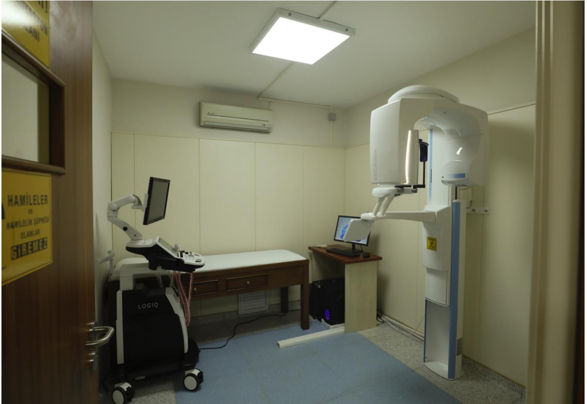
*Ağız ve Diş Sağlığı Uygulama ve Araştırma Merkezi