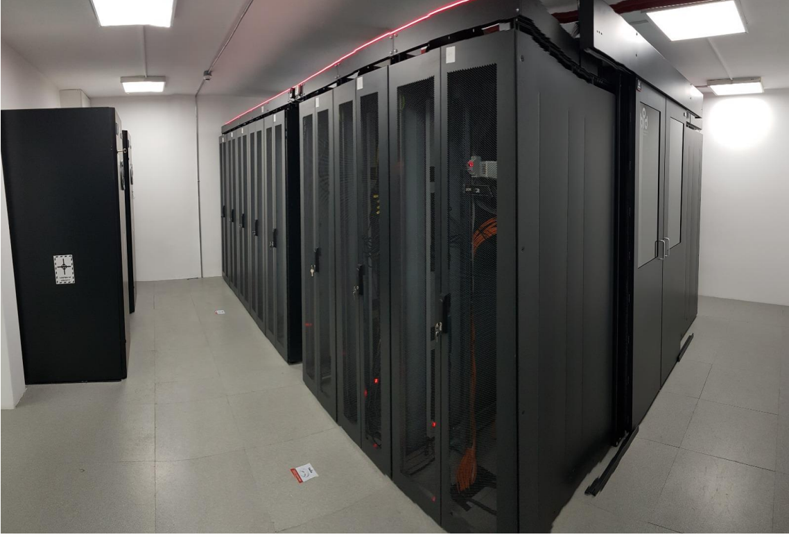
*Sistem Odası Revizyonu