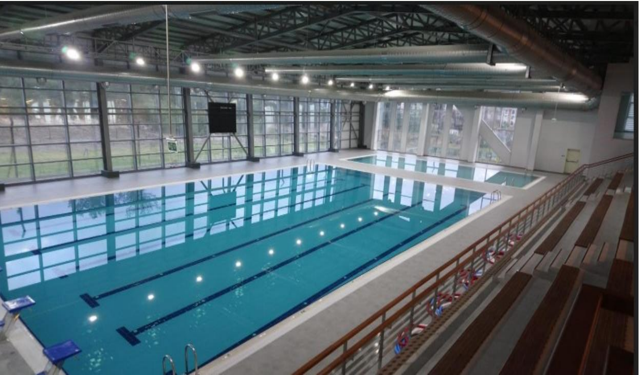
*Tınaztepe Yerleşkesi Yarı Olimpik Yüzme Havuzu