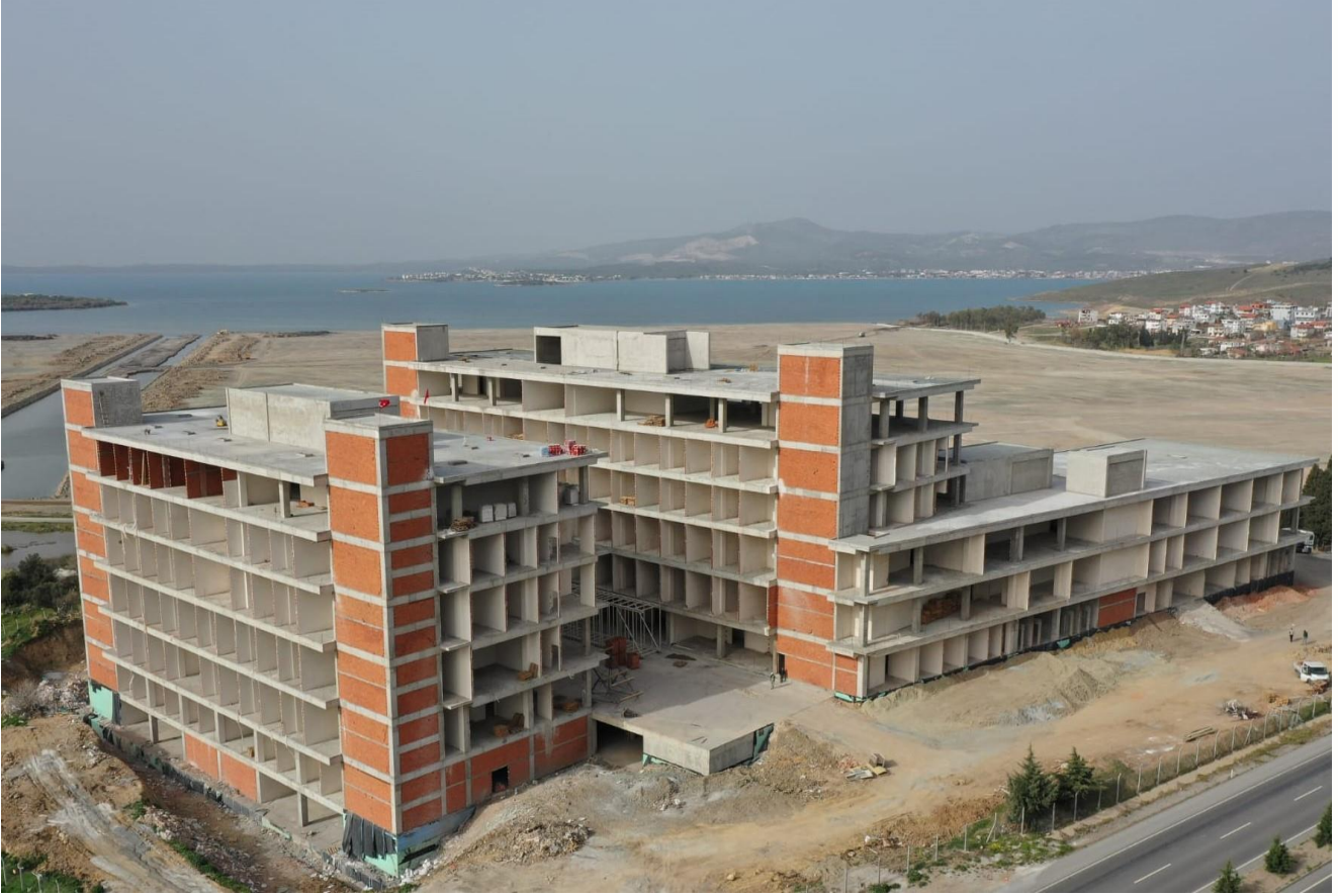
*Aliğa Mesleki ve Çevresel Hastalıklar Hastanesi İnşaatı