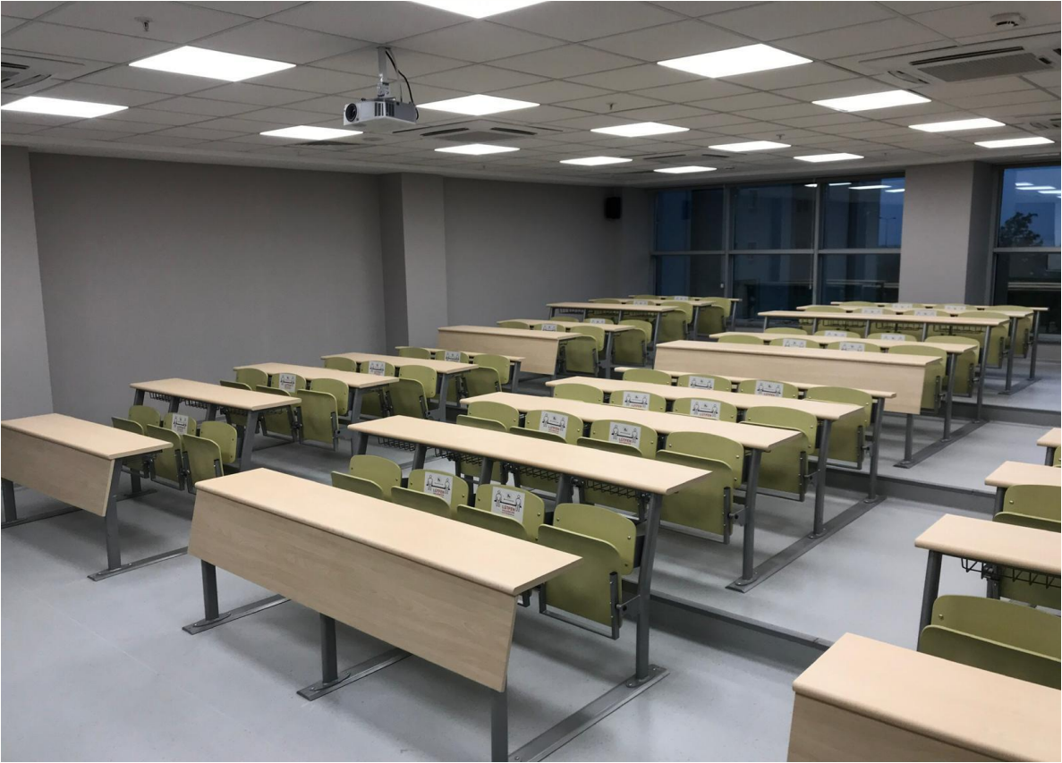
*15 Temmuz Sağlık ve Sanat Yerleşkesi Ortak Derslikler Binası