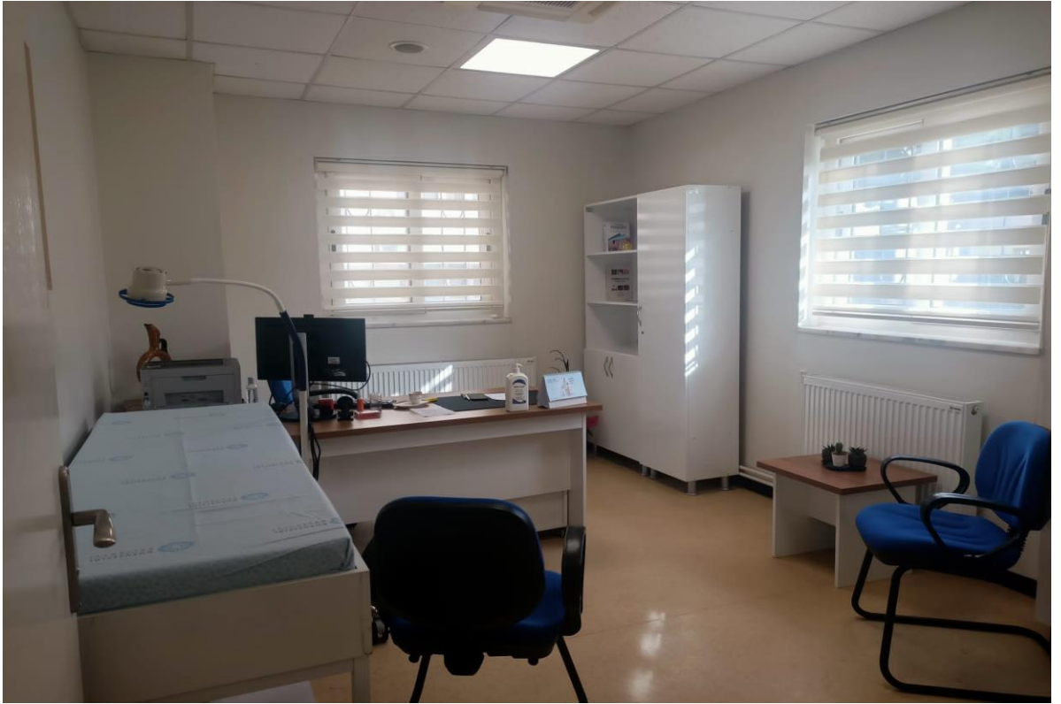
*Tıbbi Estetik ve Kozmetoloji Ünitesi