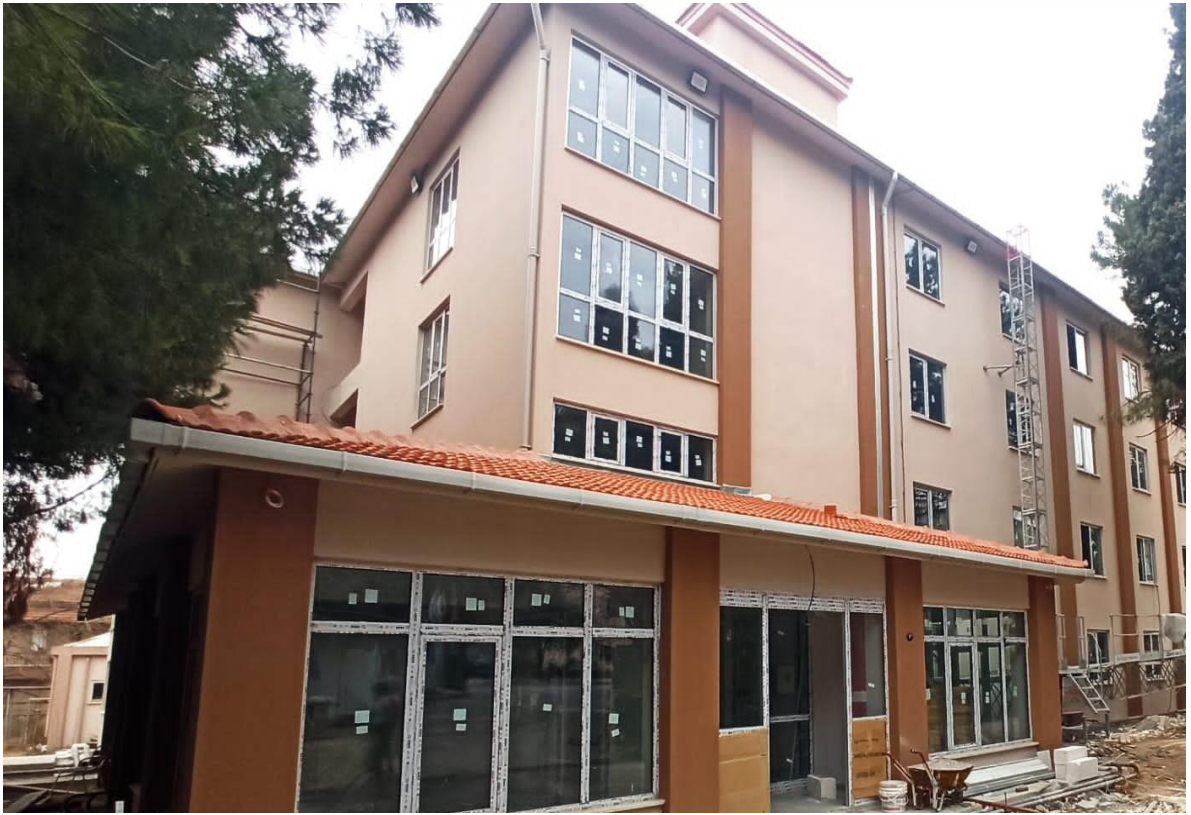
*Buca Kız Yurdu Güçlendirme İnşaatı