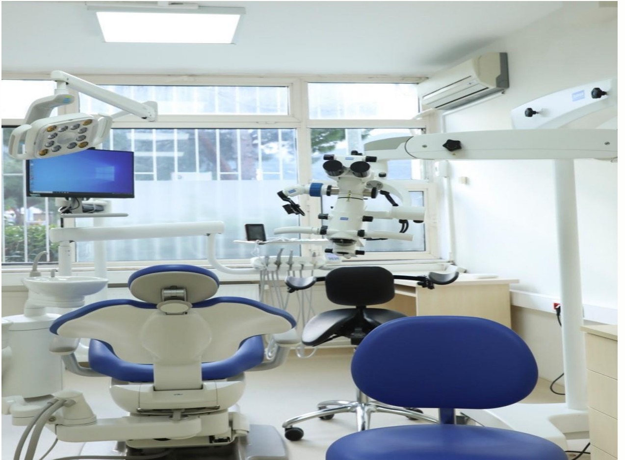
*Ağız ve Diş Sağlığı Uygulama ve Araştırma Merkezi