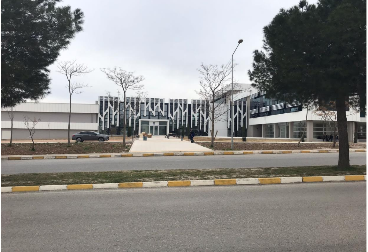
*Yabancı Diller Yüksekokulu Binası