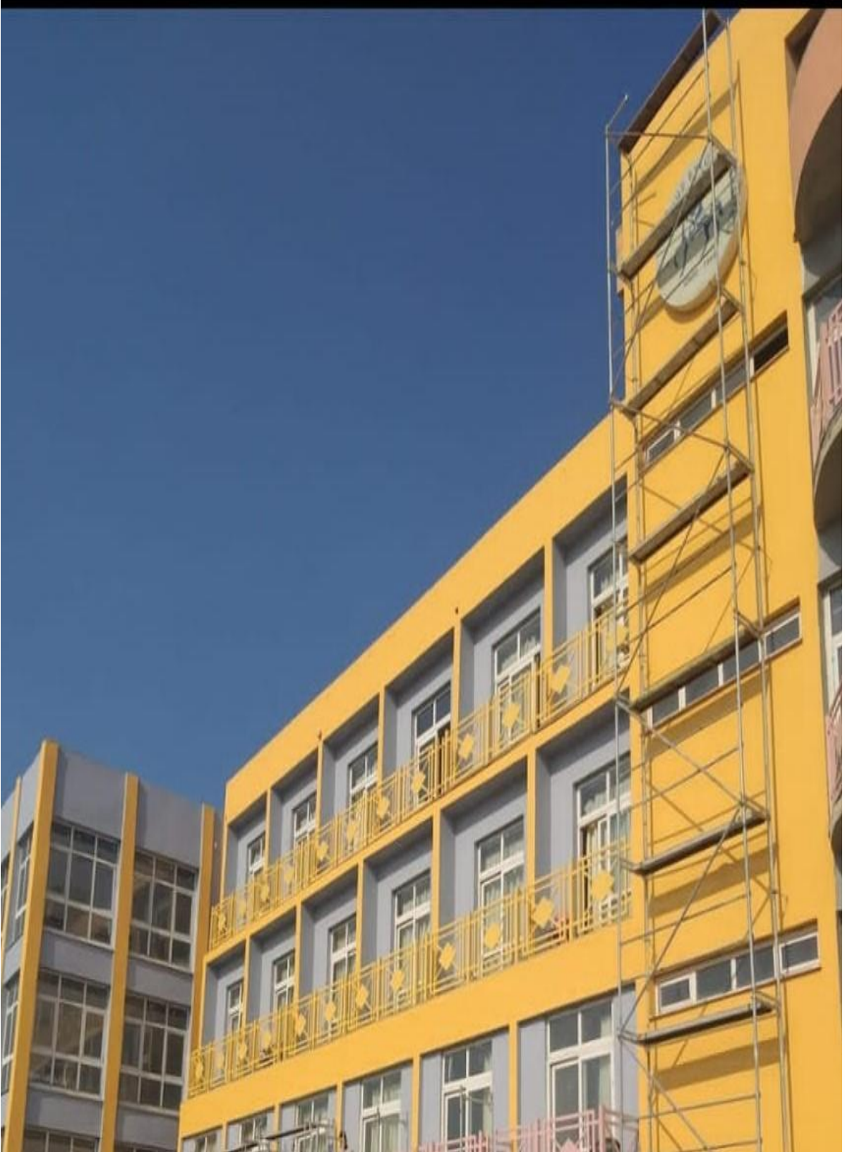
*Buca Öğrenci Yurdu Tadilatı