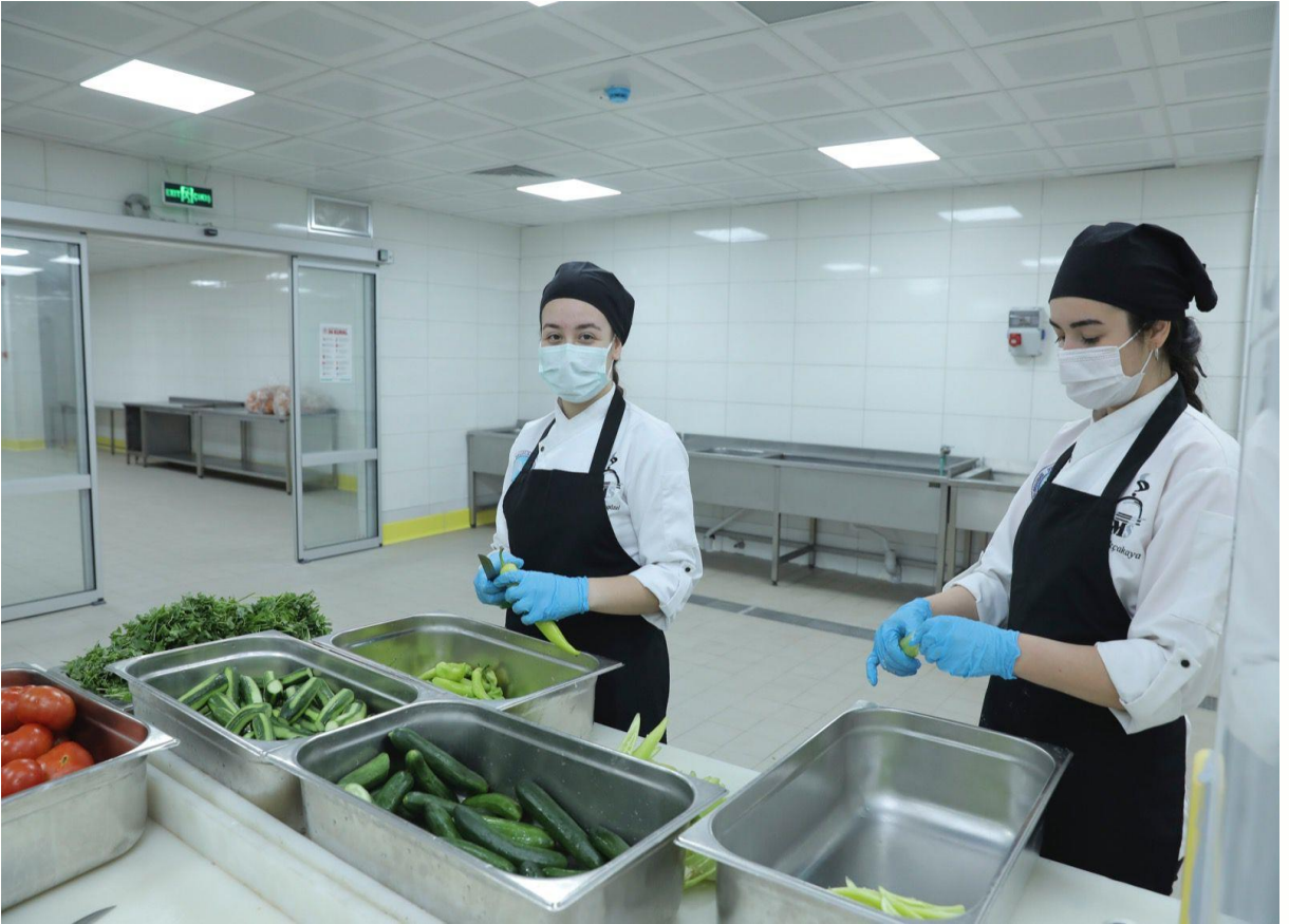
*Tınaztepe Mevcut Merkez Yemekhane Binası Mutfak Tadilatı