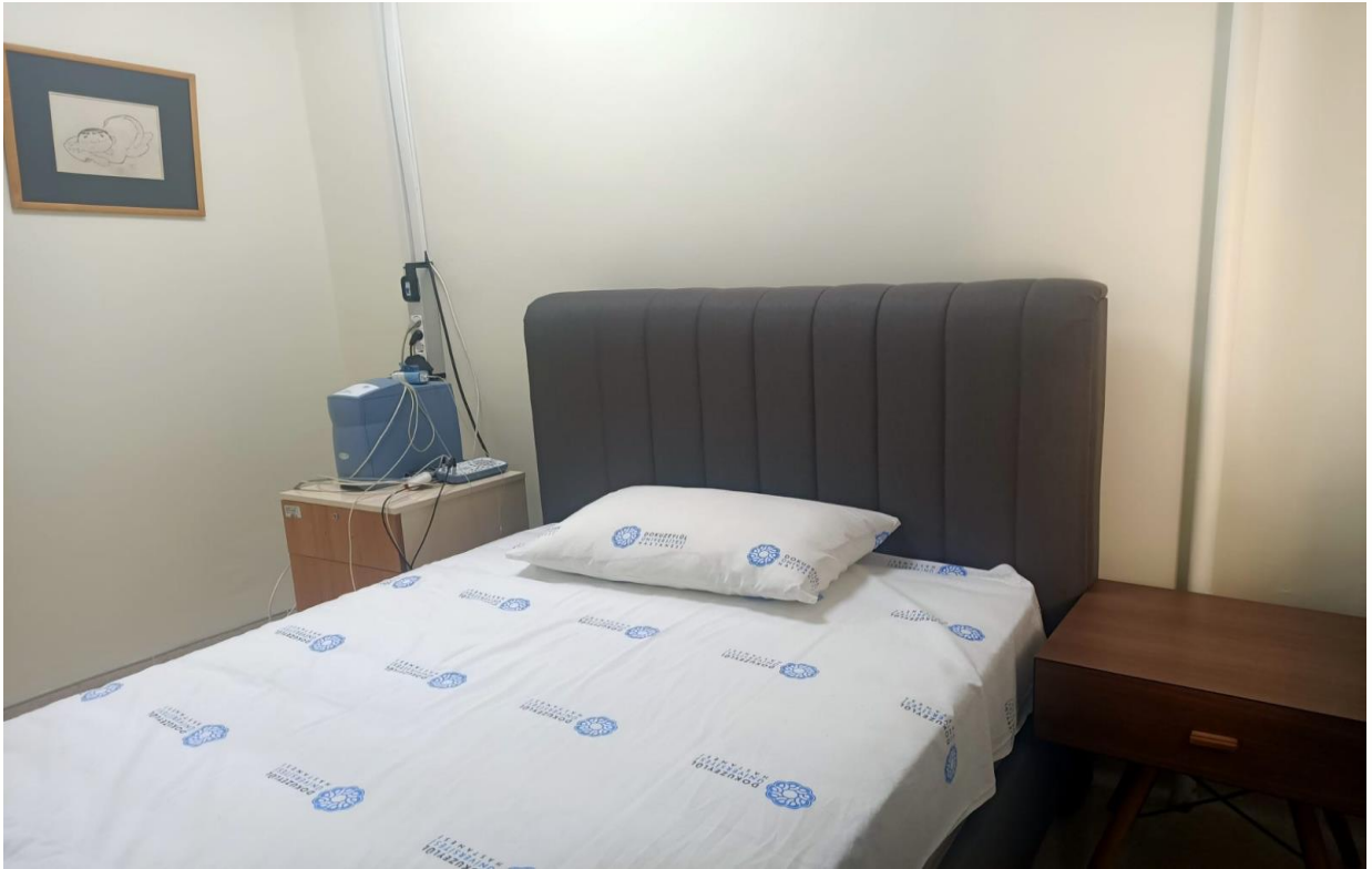
*Uyku Bozuklukları ve Epilepsi İzlem Merkezi