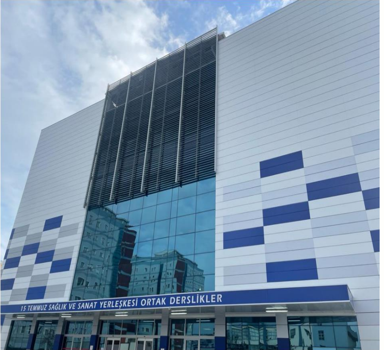
*15 Temmuz Sağlık ve Sanat Yerleşkesi Ortak Derslikler Binası

28.07.2020 tarihinde ihalesi yapılan “İnciraltı Yerleşkesi Hemşirelik Fakültesi Derslik Binası Tamamlama İnşaatı” işinin sözleşmesi 01.10.2020 tarihinde 8.444.000-TL bedel ile imzalanmıştır. Söz konusu iş 2021 yılsonu itibariyle tamamlanmıştır.(Tamamlanan bina “15 Temmuz Sağlık ve Sanat Yerleşkesi Ortak Derslikler Binası” olarak isimlendirilmiştir.)