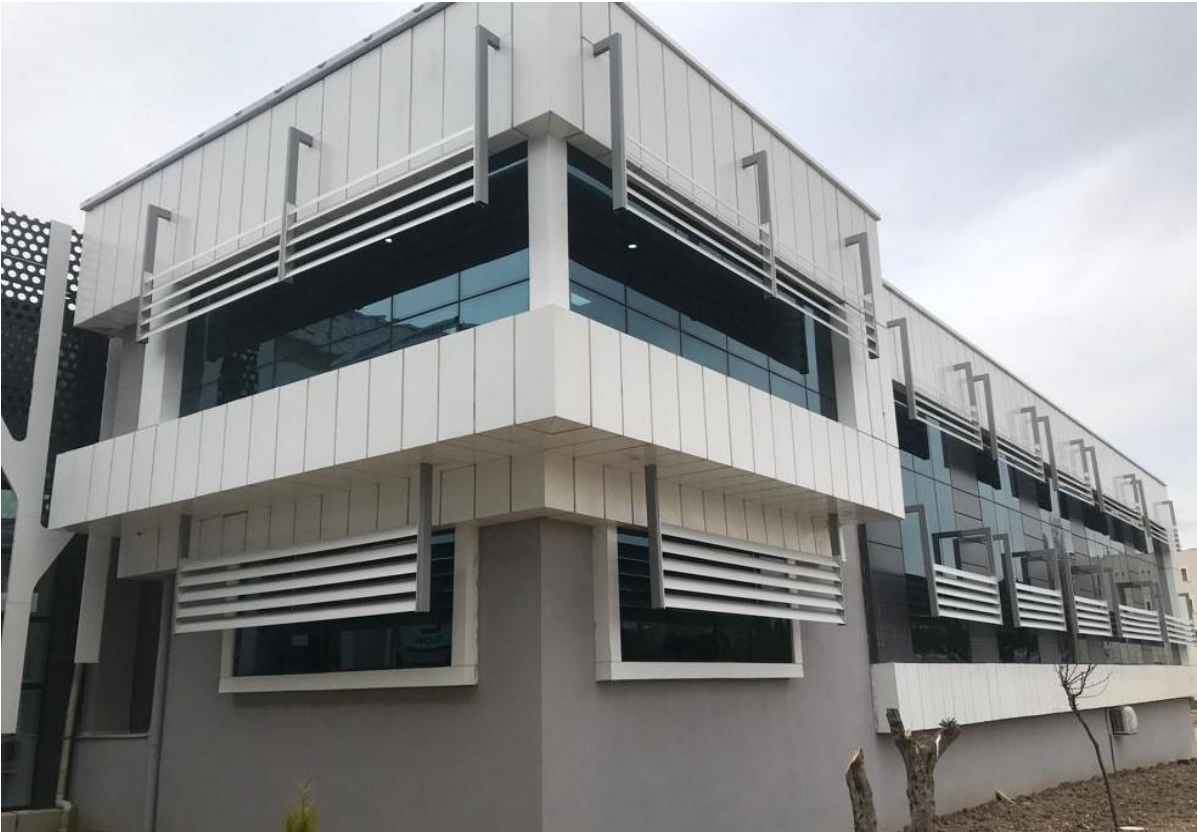
*Yabancı Diller Yüksekokulu Binası