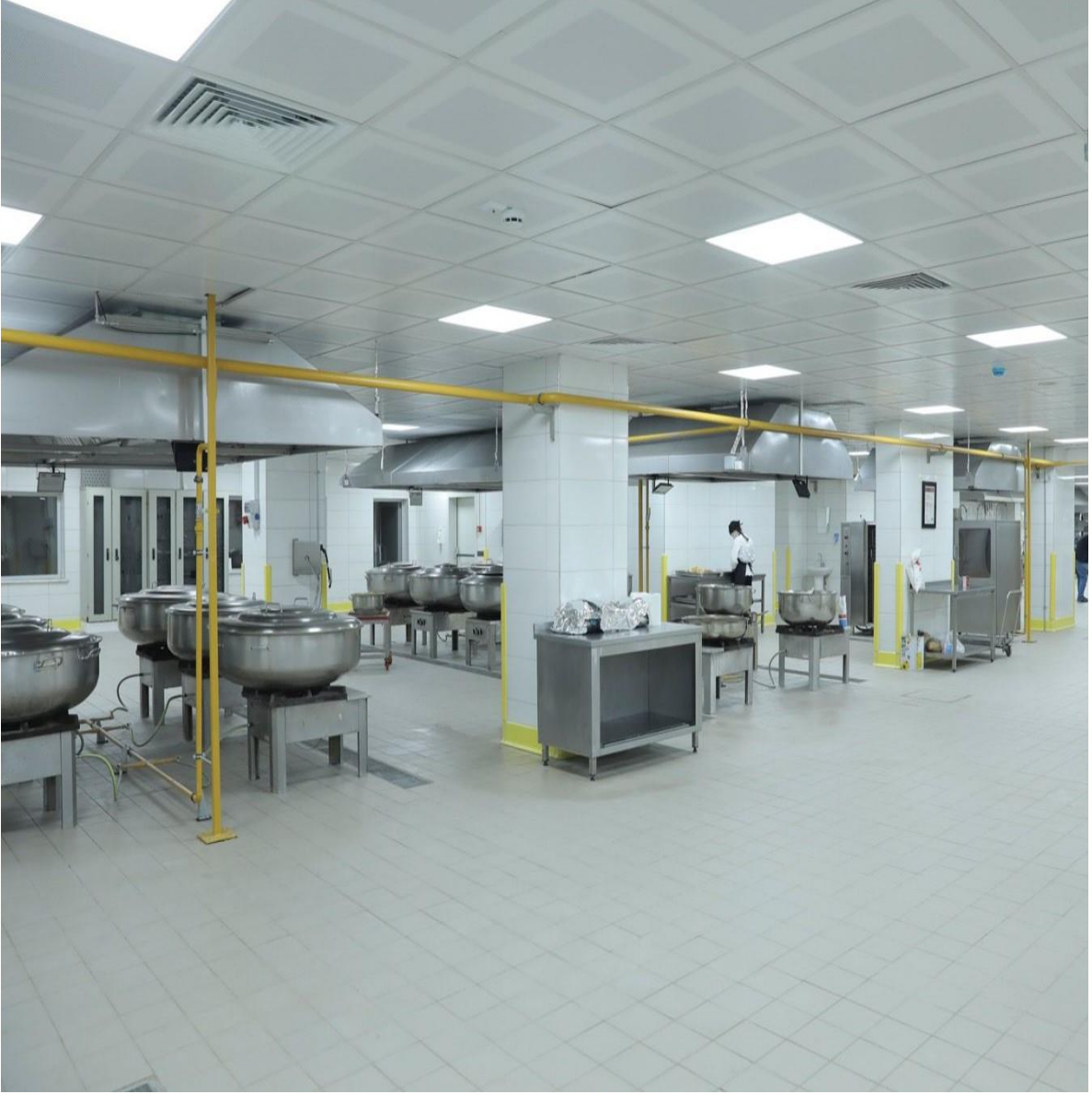
*Tınaztepe Mevcut Merkez Yemekhane Binası Mutfak Tadilatı