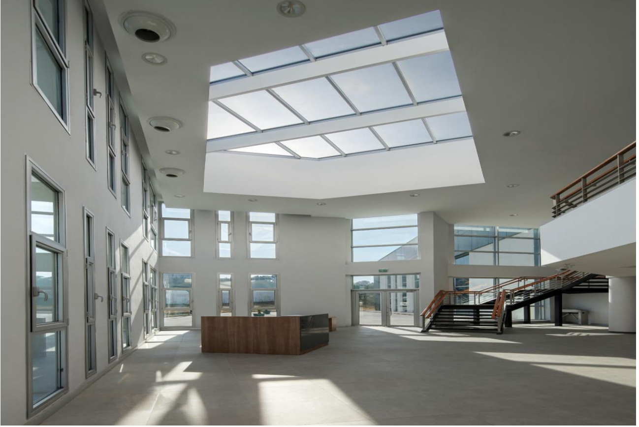
*Tınaztepe Yerleşkesi Yarı Olimpik Yüzme Havuzu iç mekan