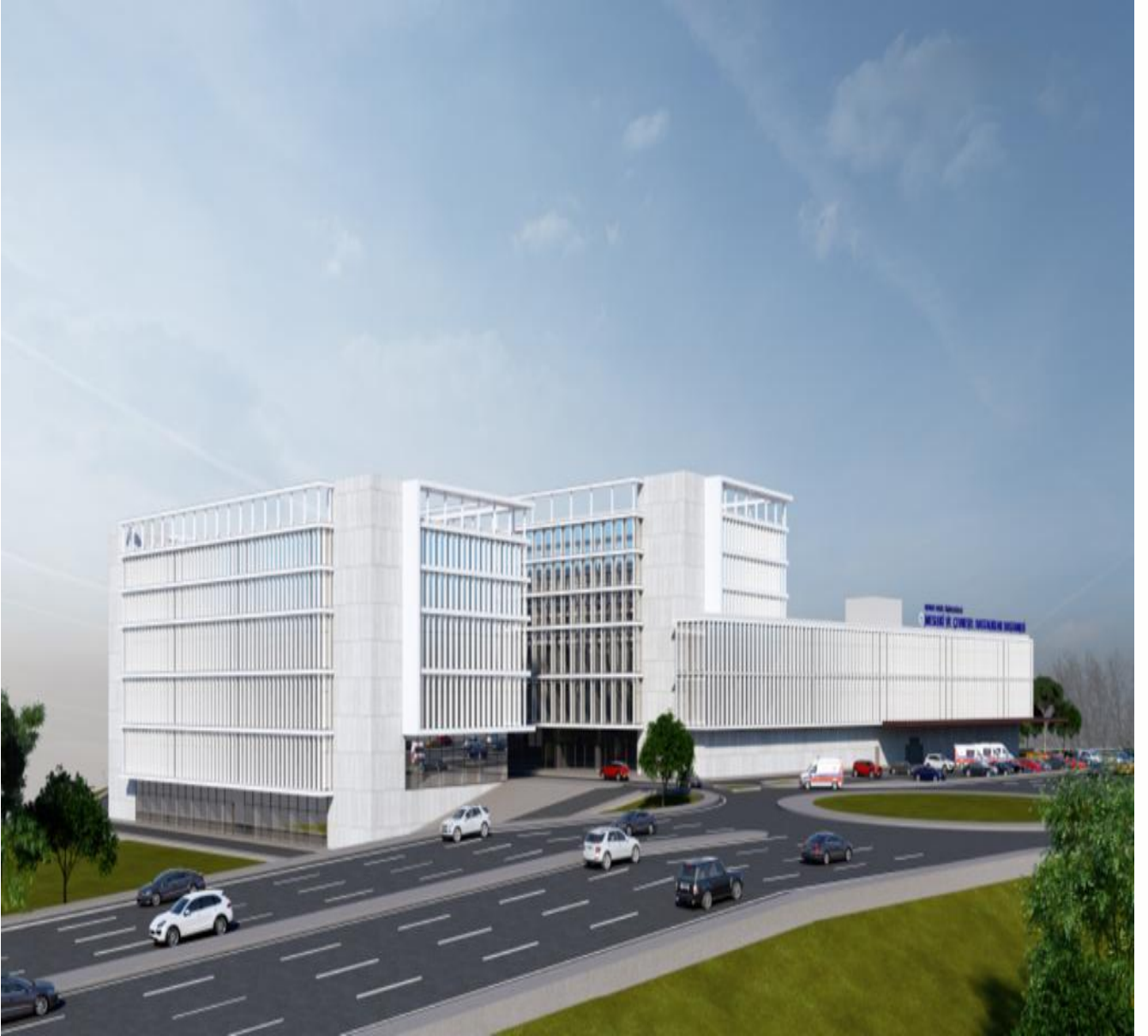
*Aliğa Mesleki ve Çevresel Hastalıklar Hastanesi

Aliğa Belediye Başkanlığı ile Üniversitemiz arasında projenin kaba inşaatının yapımına ilişkin imzalanan protokol doğrultusunda, yatırım programımızda 90.000.000-TL tutarındaki hibeye karşılık olarak yapım işlerine başlanmış olup, 2022 yılının Nisan ayında tamamlanacaktır.